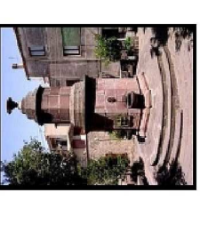
TAVOLA 14 C.U. CARTA PDF VIGENTE 1: 2.000

ADEGUAMENTO DEL PIANO URBANISTICO COMUNALE (P.U.C.) AL PIANO PAESAGGISTICO (P.P.E.) E AL PIANO ASSETTO IDROLOGICO (P.A.I.) DEL COMUNE DI SCANO MONTIFERRO